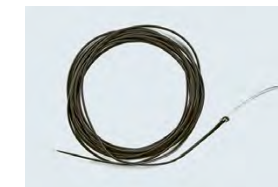
Sinktipp mit Tungstenaustaub zur Beschwerung (Fliegenfischen)