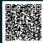
PDF des Flyers

Nicht nur Blei ist für Lebewesen in Gewässern problematisch. Auch Kunststoffe wie Gummi, Angelschnüre und andere synthetische Materialien können schädliche Wirkungen auf Wasserlebewesen haben, sei es durch Freisetzung problematischer Stoffe oder infolge ihrer Aufnahme mit der Nahrung. Deshalb ist auch darauf zu achten, dass diese Materialien nicht in die Umwelt gelangen. Die Natur dankt's!